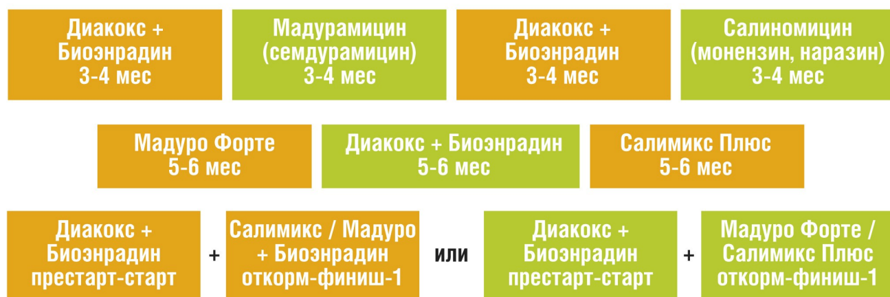
Рис. 6. Схемы возможных программ ротации в Украине

Компания ООО «АТ Биофарм», как украинский производитель, готова разработать программу контроля здоровья кишечника птицы для любого, даже самого требовательного, клиента, без значительного увеличения стоимости комбикорма, обеспечивая при этом весь комплекс мер по сопровождению и сервису такой программы.